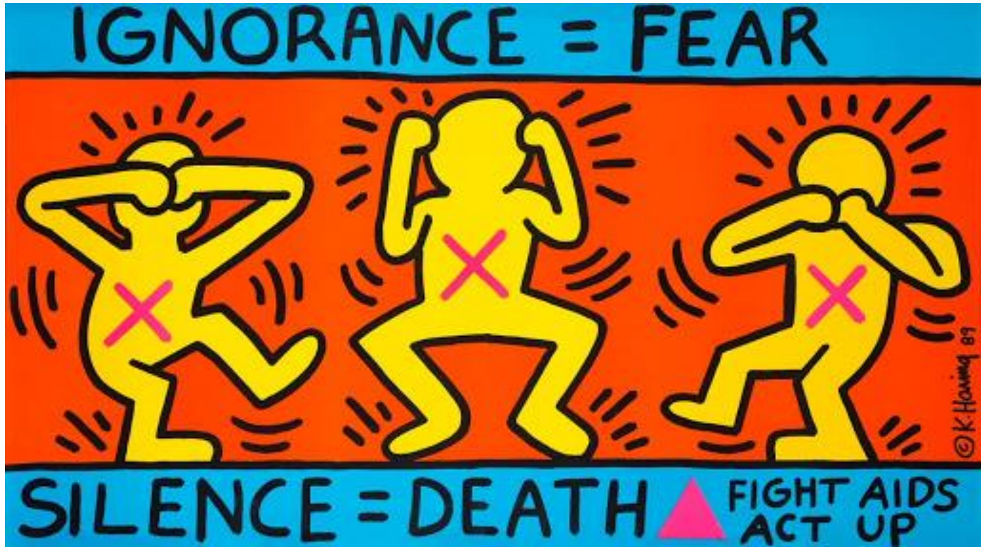
בורות(טיפשות)=פחד, שתיקה=מוות. קית הרינג, 1989